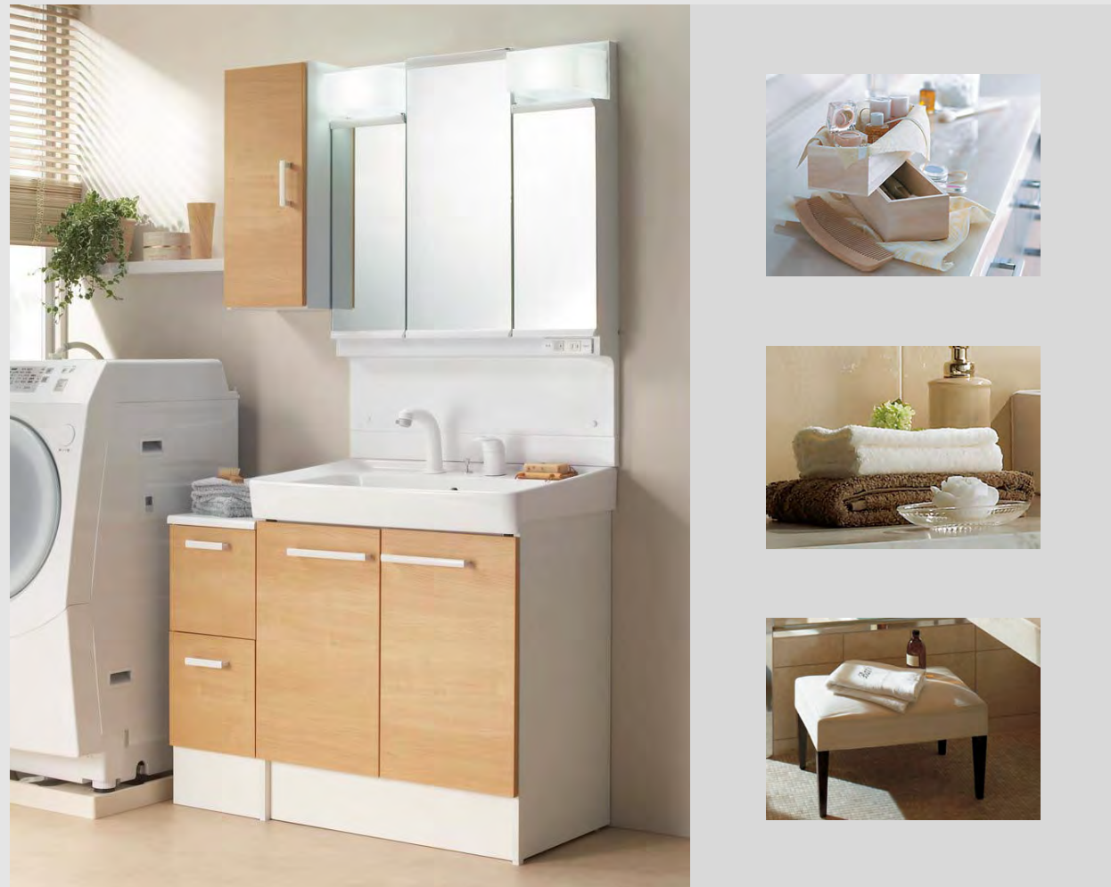
写真はイメージです。見積内容とは異なります。