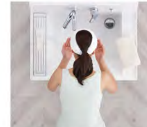
洗顔・洗髪もゆったりスペースで