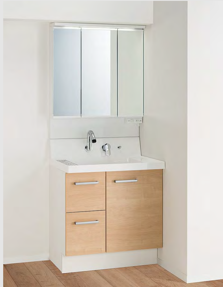
写真はイメージです。見積内容とは異なります。