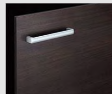
□ LD2 クリアーク