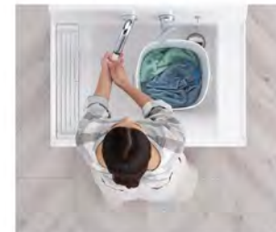
つけ置き洗い中も、バケツを避けての手洗いもOK