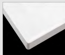
□ H グリーンホワイト