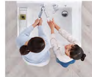
2人並んでの身支度もスムーズ