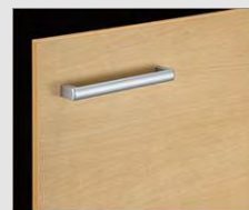
□ LP2 クリアール