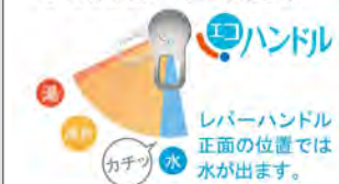
レバーハンドル正面の位置では水が出ます。お湯が混合する位置はクリックでお知らせします。