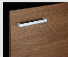
□ LM2 クリアモ