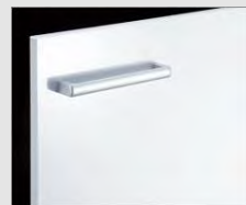
□ YS2 グロスホワイト