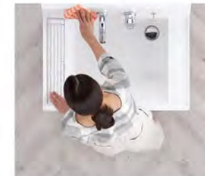
汚れにくくお掃除もカンタン