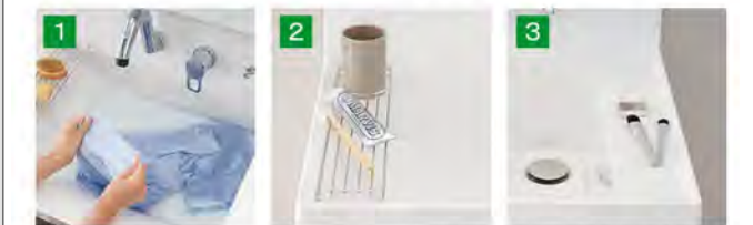
バケツの水汲みや衣類のつけ置き洗いもしやすいです。コップや泡立てネットなど、濡れものを気兼ねなく置けます。濡らしたくないものを、一つ置き洗いしやすいため、時置きするのに便利です。